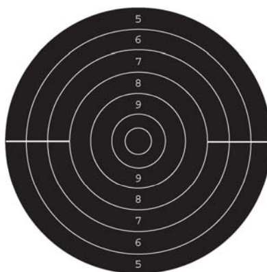
Fig.1 - blanco tiro rápido